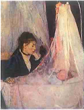
A- La cuna

3- Identifica el/la autor/a, época, movimiento y/o estilo de las obras A y B. Compáralas atendiendo a sus elementos formales y a la intención expresiva del autor/a. (2 puntos)