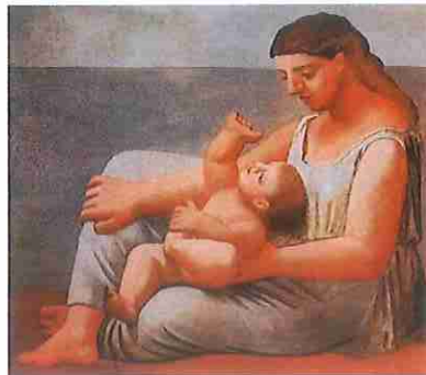
B- Madre e hijo a orillas del mar

4- Cita a los pintores postimpresionistas y desarrolla brevemente sus principales características. (1,5 puntos)