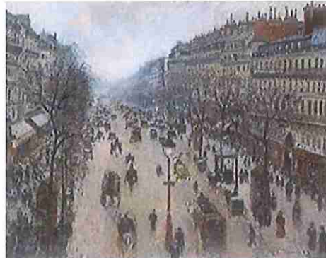
B- Boulevard de Montmartre

4- Describe brevemente los periodos en la obra de Goya y profundiza en su etapa de las "pinturas negras". Nombra alguna de las obras de la mencionada serie. (1,5 puntos)