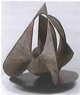
B- El Mundo

4- Describe la importancia de Nadar y su relación con la fotografía de su época. (1,5 puntos)