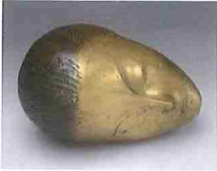
A- Musa durmiendo

3- Identifica el/la autor/a, época, movimiento y/o estilo de las obras A y B. Compáralas atendiendo a sus elementos formales y a la intención expresiva del autor/a. (2 puntos)