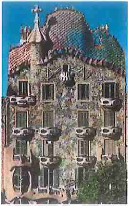
A- Casa Batlló

3- Identifica el/la autor/a, época, movimiento y/o estilo de las obras A y B. Compáralas atendiendo a sus elementos formales y a la intención expresiva del autor/a. (2 puntos)