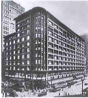
B- Almacenes Carson

4- Describe el surrealismo en el cine, utilizando como ejemplo la obra de Dalí y Buñuel "Un perro andaluz". (1,5 puntos)