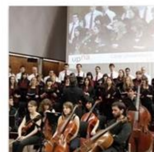
Cultura y Deportes